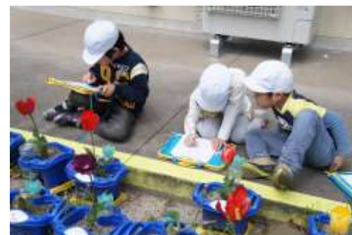
No aprendizado de matéria (Atividades diárias) no ensino fundamental I 「Vamos encontrar a primavera」

Baseando-se na 「Folha de suporte do desenvolvimento de crianças de meia idade」 o responsável e a escola, realiza a reflexão para a criação e o desenvolvimento da criança, realizando o suporte até a escola.