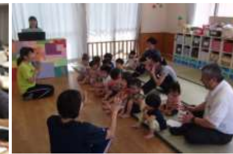
Experiência de professores de ensino fundamental I nas escolas infantil

Conexão da escola infantil para o ensino fundamental I. Transição do 「Aprender brincando」 para o 「Aprender」