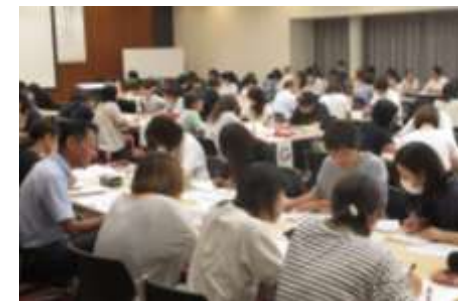
Seminário em conjunto com a escola infantil

Através da 「Percepção do semblante」 com a cooperação de professores de escolas infantil e escolas de ensino fundamental I aplicaremos o progresso na qualidade da educação.