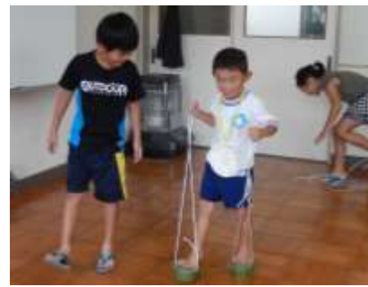
Intercâmbio de crianças e bebê

Através da 「Percepção do semblante」 com a cooperação de professores de escolas infantil e escolas de ensino fundamental I aplicaremos o progresso na qualidade da educação.