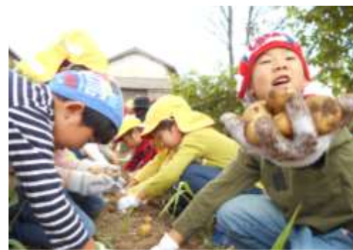
Colher batata na escola infantil

Conexão da escola infantil para o ensino fundamental I. Transição do 「Aprender brincando」 para o 「Aprender」