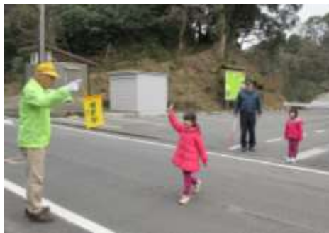
Patrulhas para a proteção na ida e vinda da escola

Todas as pessoas da região, ajudam a proteger as crianças, proporcionando um desenvolvimento proveitoso.