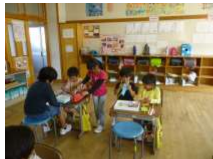
Dia de intercâmbio infantil

Através de intercâmbios de crianças das escolas infantil e escolas de ensino fundamental I, consegue vivenciar experiências e desenvolver um psicológico afetivo.