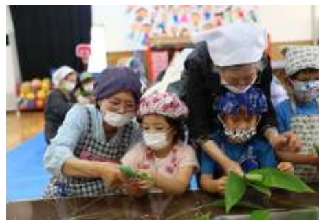
Aprendizado de conteúdo cultural