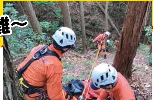
▲令和4年 山岳救助訓練の様子