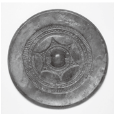
釜代1号墳の鏡(松江市蔵)