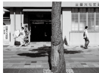
▲出雲大社 神門通りにて

太平洋戦争終結から77年、沖縄の本土復帰から50年。沖縄に向けて出雲から爆撃機が出撃していたことも沖縄に特攻機を飛ばすのに松の油を使おうとしていたことも忘れられています。出雲大社神門通りの松並木に残された戦争の傷痕をご紹介します。