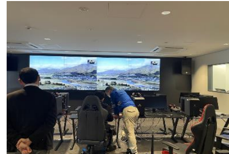
サンガスタジアム・イノベーション・フィールド 実証支援事業(ドローン遠隔操作実証実験)