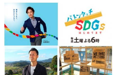
首都圏へのアプローチの成果としてメディア出演