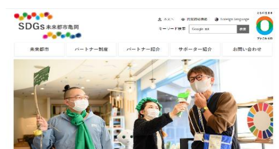
SDGs未来都市亀岡を発信する特設ホームページ