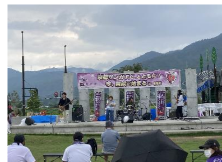
かめおかecoマルシェ