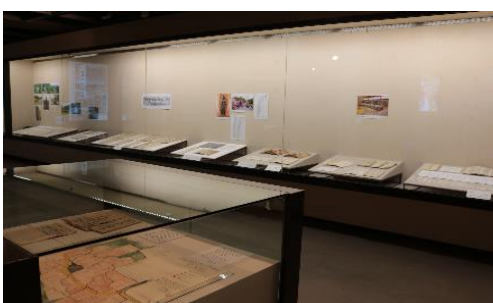
第69回企画展 丹波の天変地異