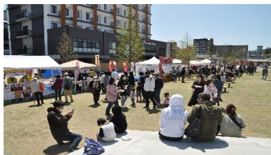
かめおか肉フェスタ