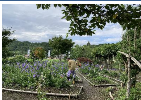
ききょうの里整備