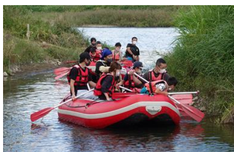
ファミリーラフティング