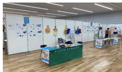
首都圏におけるPRイベントの様子