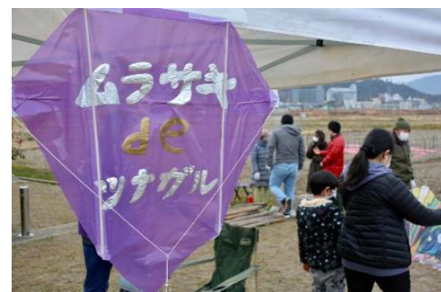
パープルスイーツプロジェクト