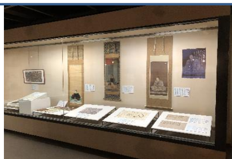
第36回特別展 光秀その後の亀山