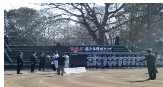
竣工式典及び竣工記念試合