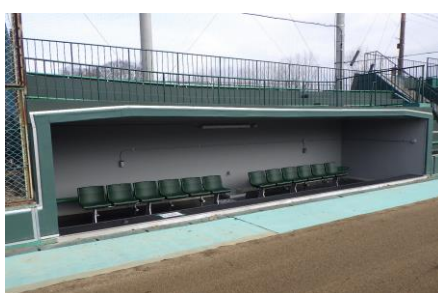
ダグアウトの新ベンチ