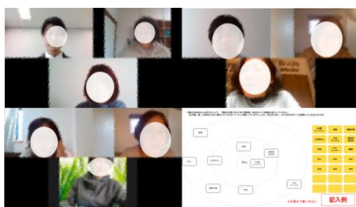
転出入調査のオンラインインタビュー