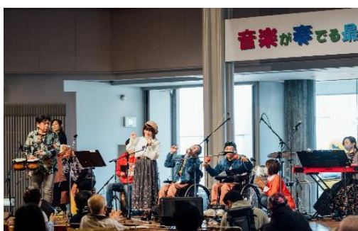
音楽が奏でる最高のひととき IN 亀岡