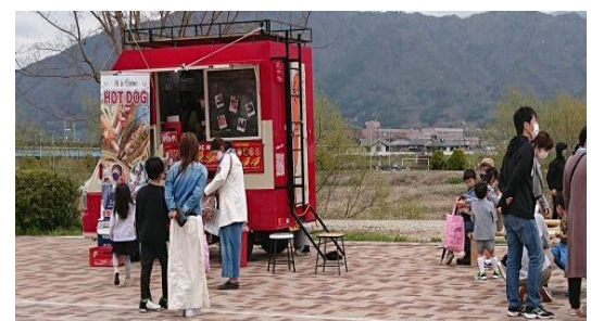
イベントスペースに出店したキッチンカー