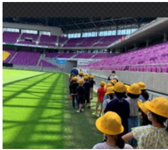
スタジアムツアー プレ実施