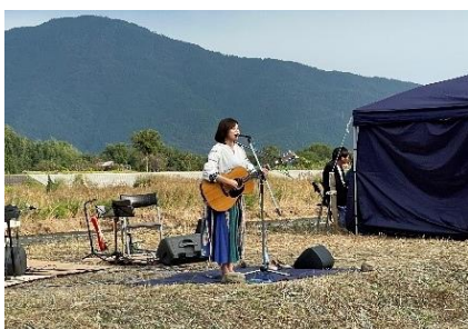
川をライブ会場としたイベント