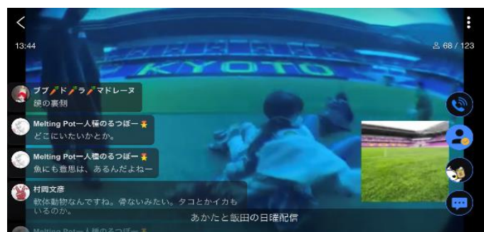
オンライン配信イベント「スタジウム」