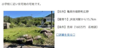
空き家・空き地バンクでのマッチング