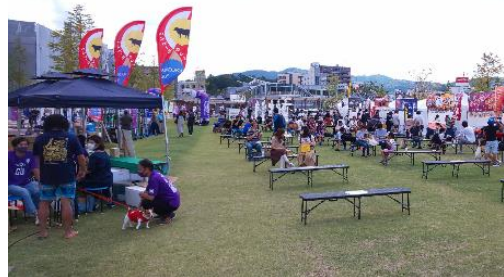
かめおかecoマルシェ