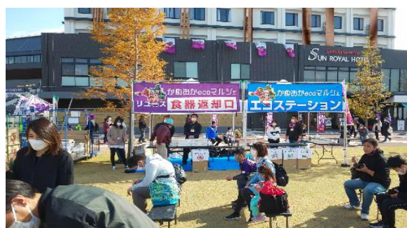
かめおかecoマルシェ