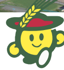
端野自治区キャラクター 「のんたくん」