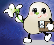
おんねゆ温泉観光 協会キャラクター 「白花マメ太郎」