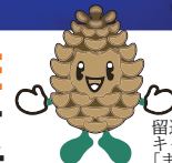
留辺蘂商業振興会 キャラクター 「まつぼう」