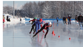
北見市民スケートリンク

北見市では市民の高いスポーツ熱のもと、スポーツ施設の整備を図り、誰もが気軽にスポーツを楽しめるスポーツ振興に取り組んでいます。