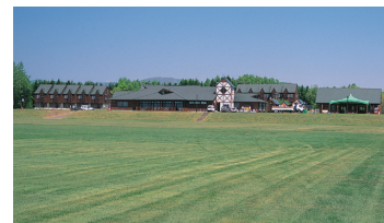
北見モイワスポーツワールド