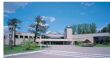
北網圏北見文化センター