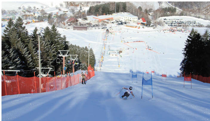
若松市民スキー場

The city will utilize these two curling halls to attract training camps, hands-on tours, elementary and junior high school classes and beginners, allowing everyone to experience and enjoy curling, and helping to continuously produce top athletes.