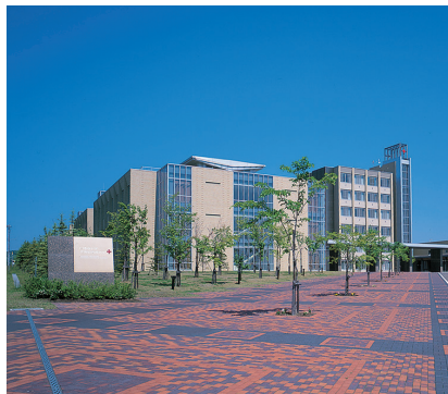
日本赤十字北海道看護大学