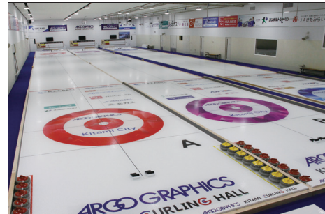
アルゴグラフィックス北見カーリングホール