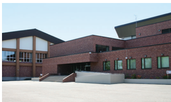
北海道立北見体育センター