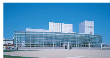
北見芸術文化ホール (きた・アート 21)