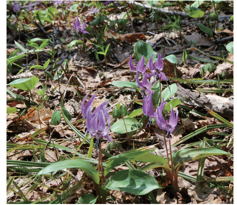
北海道レッドリストの留意種に選定されているカタクリ（端野自治区）