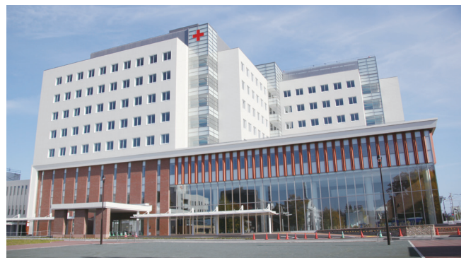
地域医療の中核である北見赤十字病院