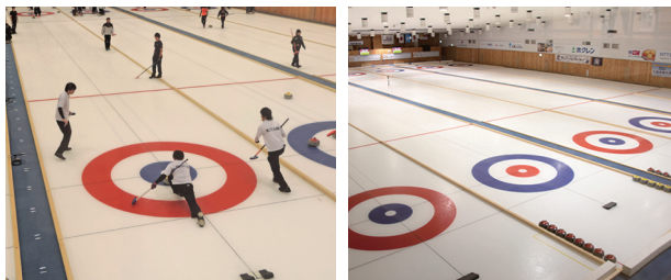
アドヴィックス常呂カーリングホール