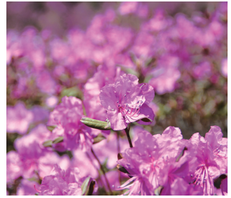
エゾムラサキツツジ（留辺蘂自治区）