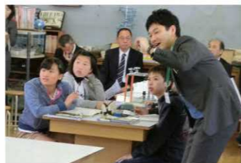
6年合同授業(中学教師による授業)