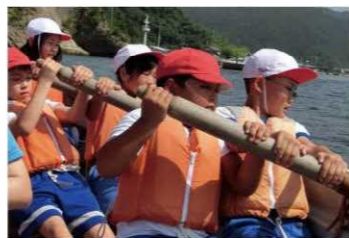
5年生合同学習(小小連携)

◎「合同学習」は小学校教員による指導。「合同授業」は中学校教員による指導。 ◎学習の効果を考え、予定外に連携の取組をする場合あり。