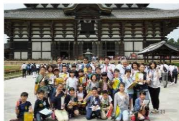
6年合同修学旅行(小小連携)