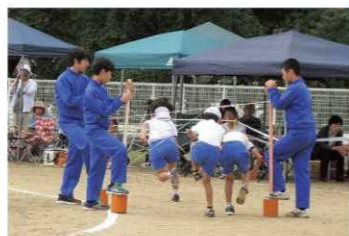
中学生の運動会運営補助