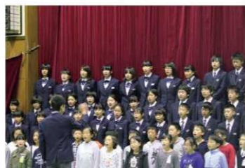
中学校文化祭への参加(小中連携)