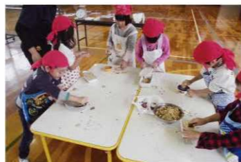
あきをたべよう(保小連携)