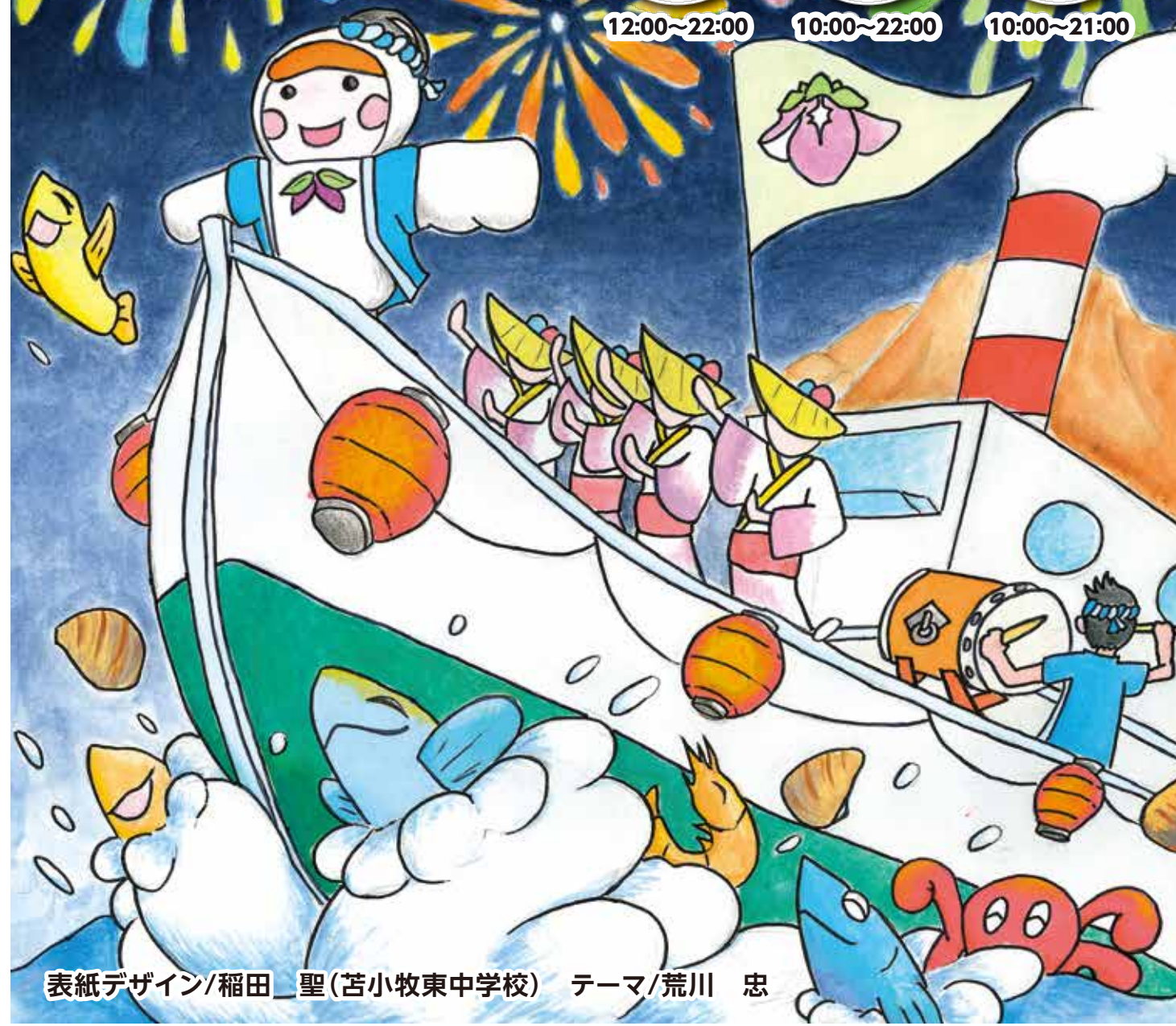
表紙デザイン/稲田 聖(苫小牧東中学校) テーマ/荒川 忠

2 金 ・3 土 ・4 日 12:00~22:00 10:00~22:00 10:00~21:00