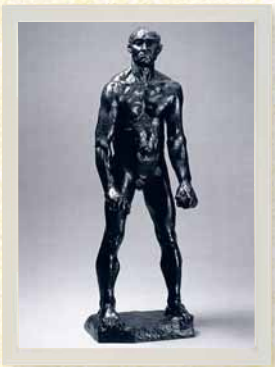
↑オーギュスト・ロダン 《ジャン・デルの裸体習作》 1886-89年頃