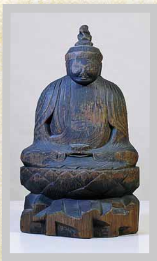
①「錦岡樽前山神社 えんくうさくたるまえごんげんぞう 円空作樽前権現像 (複製)」