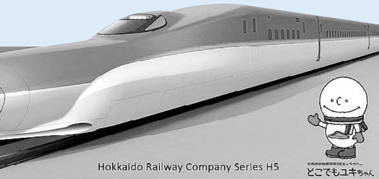
Hokkaido Railway Company Series H5