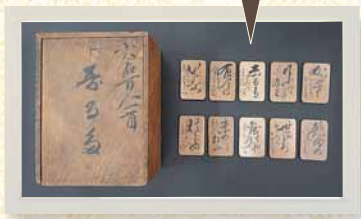
↑「小倉百人一首寄る多 (当館所蔵)」