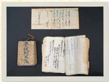
↑ 当館所蔵の古文書