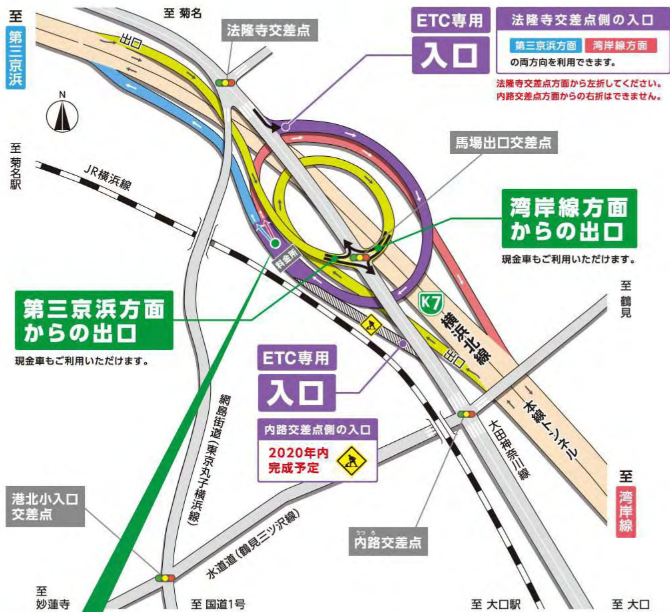
馬場入口拡大図(料金所付近) ※2020.2.27 開通時点の形態