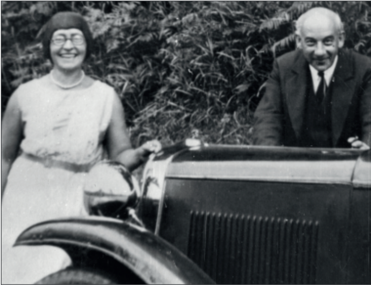
Eva und Victor Klemperer bei einer Ausfahrt 1936 mit ihrem gebrauchten Opel, den sie 1940 abgeben mussten.