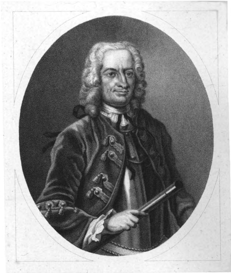
Naxos