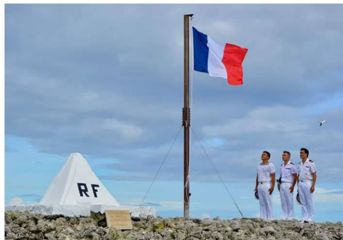
Le monument et le pavillon qui rappellent la souveraineté française

C'est en 1858 que Napoléon III a décrété la prise de possession de l'île par la France. Elle sera toutefois longtemps contestée par le gouvernement mexicain, et le règlement du litige n'aboutira qu'en 1931, lorsqu'un arbitrage international accordera définitivement la souveraineté sur Clipperton à la France. Celle-ci sera ensuite officiellement reconnue par le Mexique en 1959. L'île a été brièvement utilisée pour des besoins militaires par les États-Unis durant la Seconde guerre mondiale sans que la souveraineté n'ait été en jeu.