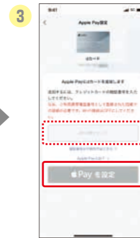
3 クレジットカードの 暗証番号を入力し、 「Apple Payを設定」を タップ。