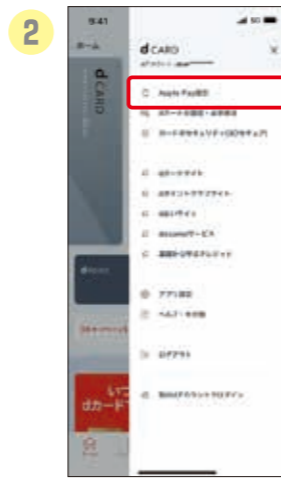
2 ログイン後、TOP画面 のmenuより「Apple Pay設定」を選択。