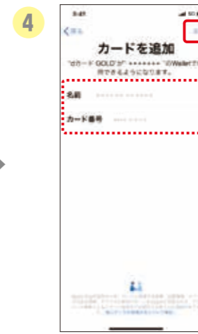
4 登録内容を確認後、規約 に同意し、設定内容を確認 して、「次へ」をタップ。