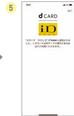
5 設定が完了しました。