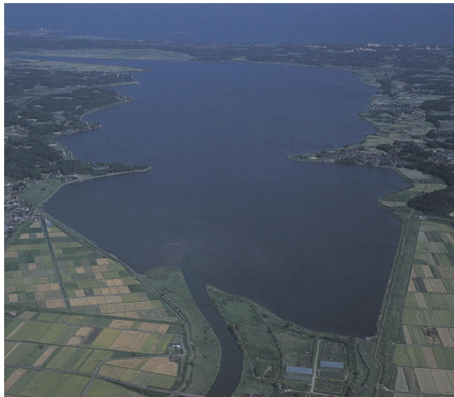
西から見た酒沼全景