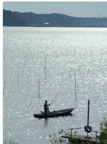
内水面漁業が盛んに行われている

周囲23.9kmある湖岸には、酒沼自然公園、筑波山を望む名勝で知られる広浦公園、砂浜のビーチが人気の親沢公園、プール遊びが楽しめるいこい