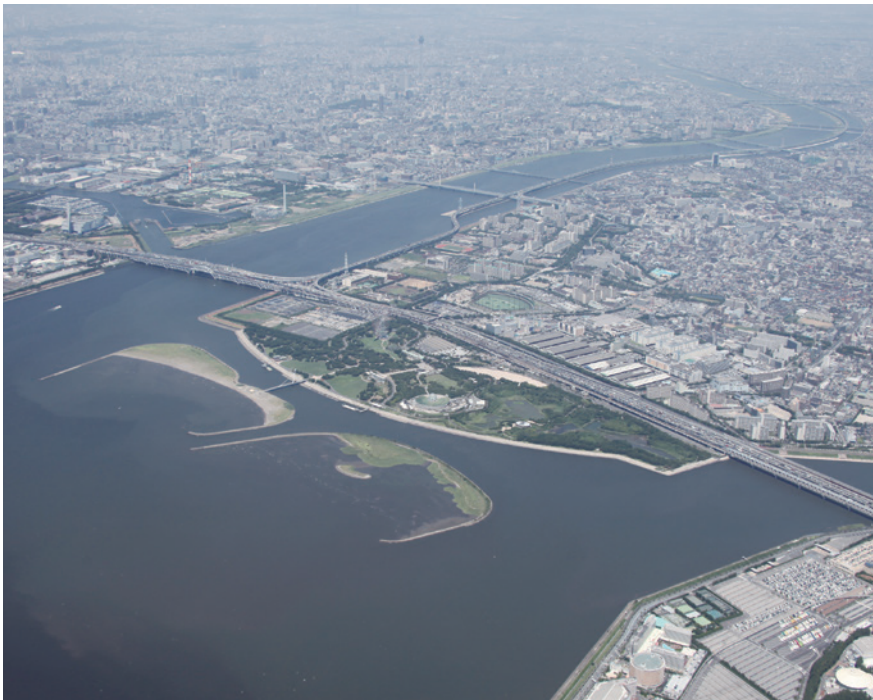
南東上空から見た葛西海浜公園