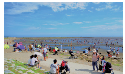
西なぎさで遊ぶ人々