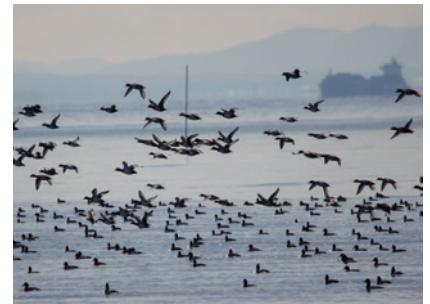
乱舞するスズガモ(冬)