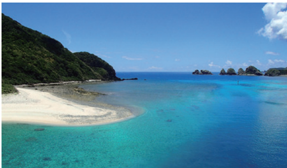
慶留間島の北岸の景観