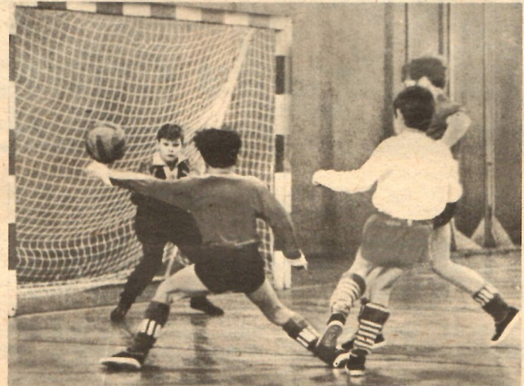
In allen Bezirken unserer Republik wird in diesen Wochen um die Bezirksmeistertitel und damit um die Fahrkarten zum Zentralen Knabenturnier in Schwerin gerungen. Diese Szene stammt aus dem Zwischenrundenspiel der Potsdamer Bezirksmeisterschaft zwischen Motor Babelsberg und Lok Eistal (3:0).

Im Bezirk Frankfurt verwies Stahl Eisenhüttenstadt die Vertretungen von Dynamo Frankfurt und Aufbau Eisenhüttenstadt auf die Plätze. Und im Titelkampf der Magdeburger in der im „Mach-mit-Wettbewerb“ geschaffenen Sporthalle in Colbitz (Kreis Wölmirstedt) hatte Chemie Schönebeck nach jeweils 1:0-Erfolgen über den 1. FC Magdeburg und Chemie Genthin die Nase vorn.