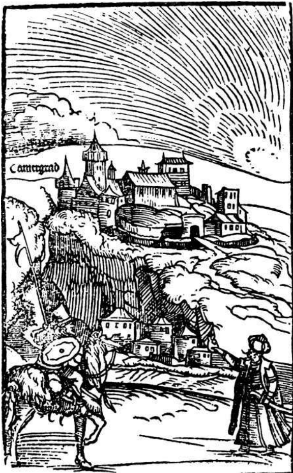
Tvrđava Kamengrad (Kuripešić, Itinerarium)

Vukčić Hrvatinić i njegovo doba, Zagreb 1902, 6 — Thallo-czy, Slovanske povelje kormendskog arkiva, Gl. Z. M. XVIII (1906), 418, 419 — B. Čerović, Nekoliko pisama iz stare Krajine, Gl. Z. M. XVII (1905), 223 — Truhelka, Pabirci iz jednog jajačkog sidžila, Gl. Z. M. XXX (1918), 167 — R. Muderizović, Nekoliko munara bosanskih valija, Gl. Z. M. XXVIII (1916), 8 — Kadića arhiv 1025. — Prilozi II 163.