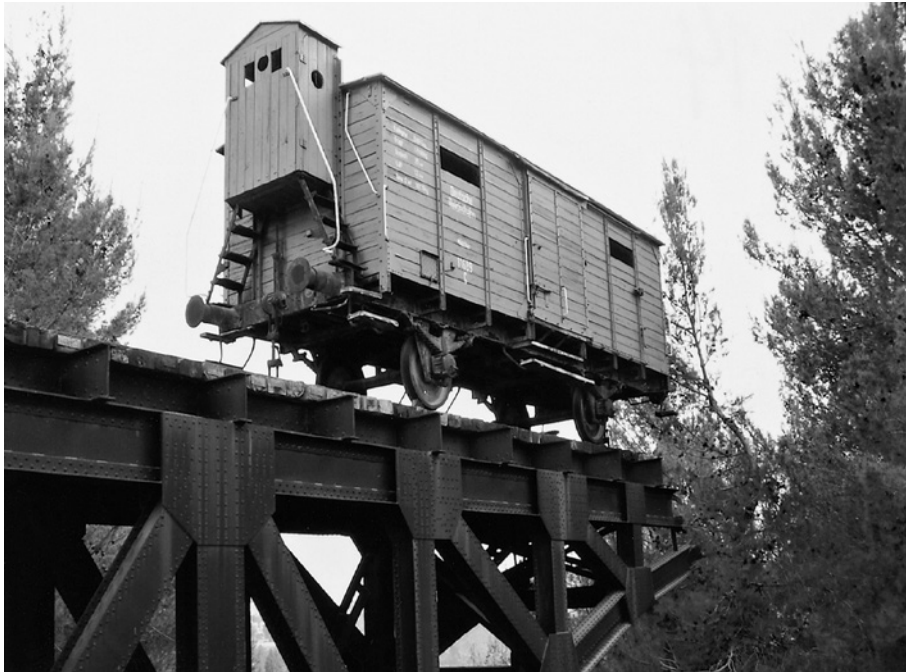
Verladung des Güterwagens für Houston (Texas) in Hahn, Dezember 2005