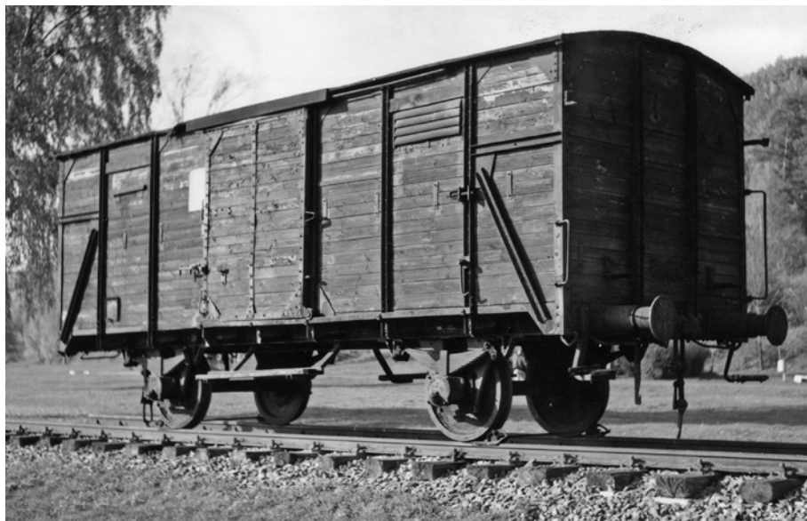
Noch unrestaurierter Güterwagen der Gedenkstätte Mittel- bau-Dora, 1998