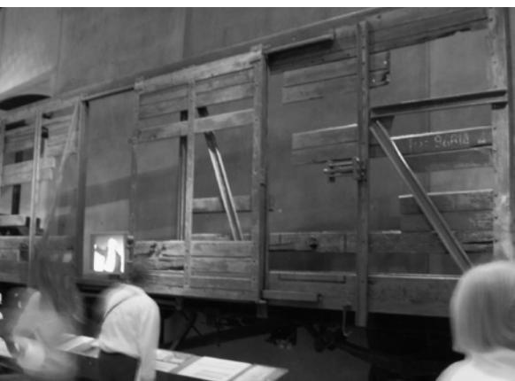
Abstraktes Waggonteil in der Ausstellung von Yad Vashem, April 2007

Nach mehr als zehn Jahren seiner Präsentation unter freiem Himmel ist das Fahrzeug bereits stark angegriffen. Der israelisch-kanadische Architekt Moshe Safdie hat dieses vor allem von deutschen Politikern, die Israel besuchen, immer wieder beachtete Objekt auf einer abgebrochenen Brücke installiert. Sie ragt vom »Berg des Gedenkens« weit über ein benachbartes bewaldetes Tal hinaus und ist wegen ihrer offensiv dramatischen Wirkung von Anwohnern gelegentlich kritisiert worden. Der Ausstellungskatalog vermerkt dazu eindeutig: »Der Viehwaggon – Das Denkmal für die Deportierten. Im Mittelpunkt der Gedenkstätte steht ein original deutscher Viehwaggon, der für die Deportation der Juden in die Vernichtungslager benutzt wurde. Am äußersten Rand von abgerissenen Eisenbahnschienen hängend, scheint der Viehwaggon gleichsam am Rande des Abgrunds innezuhalten – Symbol der Reise in Vernichtung und Vergessenheit. Darin, dass das Denkmal den Hügeln Jerusalems gegenüber gestellt wurde, drückt sich jedoch auch die ewige Hoffnung und die Erneuerung des Lebens nach dem Holocaust aus.« 38