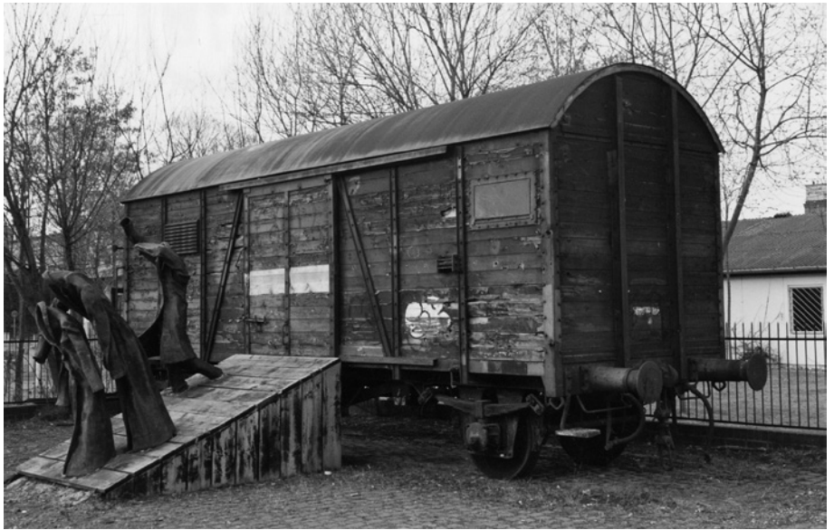
Güterwagen mit Figurengruppe von E. R. Nele am Mahnmahl in Kassel, 1999.

Etwa zur gleichen Zeit vor dem Ende der DDR beschafft, lagern heute noch in der brandenburgischen Gedenkstätte und Museum Sachsenhausen bei Oranienburg die eisernen Teile des Fahrgestells und Aufbau zu einem gedeckten Reichsbahn-Güterwagen. Bis jetzt hat sich aber keine Gelegenheit ergeben, diese Elemente in einer Ausstellung der brandenburgischen Gedenkstätten zu verwenden. Eine Präsentation am nahegelegenen Bahnhof Sachsenhausen scheiterte an den erforderlichen Genehmigungen und an den fehlenden Mitteln. 2