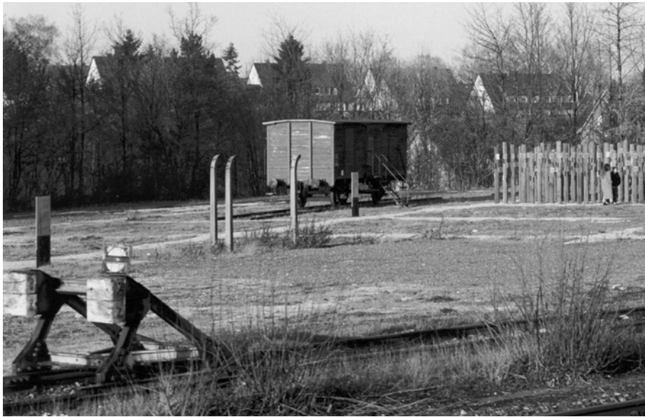
Gedenkstätte mit Güterwagen in Schwäbisch Hall-Hessenthal, Februar 2005.

Güterwagens am Platz des ehemaligen Lagerbahnhofes und die Teilrekonstruktion der Gleistrasse erfolgte 1994 im Rahmen eines internationalen Jugend-Workcamps. Die in den Raummaßen des Waggons gegossene Zementfläche mit den Fußabdrücken dient der Veranschaulichung der Enge, die während der Transporte herrschte. Überlebende Häftlinge berichten, dass bei manchen Transporten die Waggons mit 80 und mehr Personen belegt waren; sie mussten dort oft viele Tage lang im Stehen oder kauern verbringen.« 6