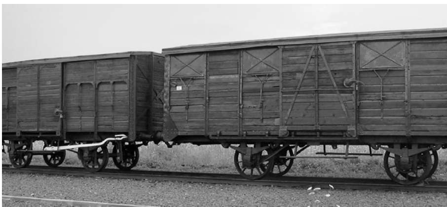
Zwei Güterwagen neben der »alten Judenrampe« am ehemaligen Güterbahnhof Auschwitz, Juli 2006