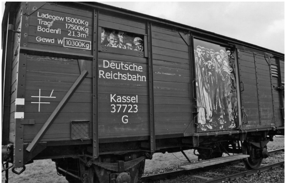
Künstlerische Ergänzung des Güterwagens in Neuengamme, März 2007

Brettern versehen. Im Jahr zuvor war vom Militär am Bahnhof Bergen bei Bauarbeiten irrtümlich ein Teil der seit September 2000 denkmalgeschützten Verladerampe abgerissen worden, die daraufhin wieder hergestellt werden musste. 9