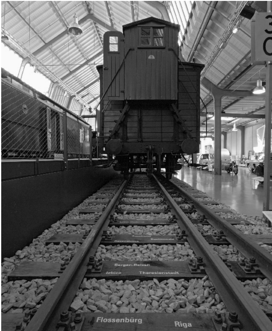
Güterwagen in der Ausstellung des Verkehrszentrums München, 2006