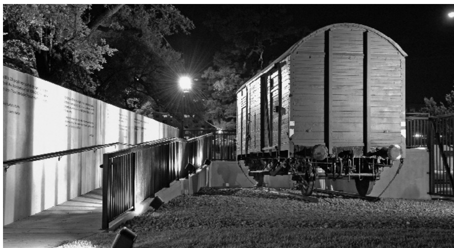
Der deutsche Güterwagen als Teil der Außenanlagen in Houston (Texas), 2006

Ein weiterer deutscher Güterwagen wurde für das »Paper Clips Project« der Whitwell Middle School in der Kleinstadt Whitwell in Tennessee (USA) verwendet, jenes Projekt, das gedanklich schon seit 1998 vorbereitet worden war. Das Fahrzeug hatte bis Anfang 2001 noch dem Eisenbahnverein »Hei Na Ganzlin« aus Röbel (Mecklenburg) gehört und war zuletzt im Hafen von Frankfurt (Oder) zum Getreidetransport eingesetzt worden. Im August 2001 war der Wagen mit Hilfe der Deutschen Bahn und der Bundeswehr über Cuxhaven nach dem Hafen von Wilmington (North Carolina) verschifft worden. Das Projekt sah in Erinnerung an bestimmte historische Vorgänge in Norwegen 1942 vor, als »The Children's Holocaust Memorial« auch den Umfang und Bürokratismus des Judenmords auf eigene Weise durch eine Sammlung unzähliger Büroklammern darzustellen. Diese sollten in den Waggon gefüllt werden. Mehr als 30 Millionen Büroklammern aus aller Welt trafen schließlich in Whitwell ein; über das Projekt wurde im Jahre 2004 der preisgekrönte Dokumentarfilm »Paper Clips« produziert. 31