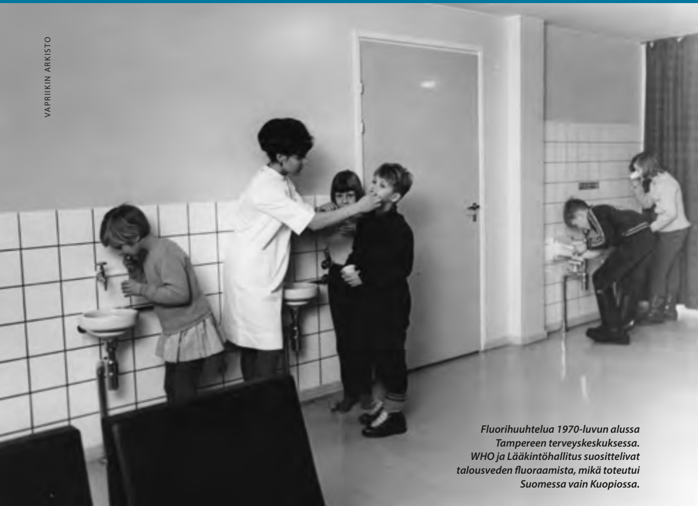
Fluorihuhtelua 1970-luvun alussa Tampereen terveyskeskuksessa. WHO ja Lääkintöhallitus suosittelivat talousveden fluoraamista, mikä toteutui Suomessa vain Kuopiossa.