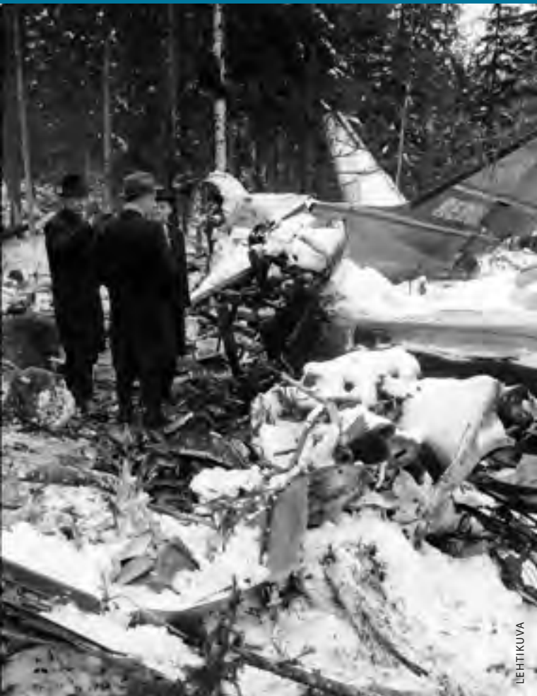
Koivulahden lentoturma 1961 toi hammaslääkärit suuronnettomuuksien tutkintaan.

▼ Nelikäsityöskentely istuvassa asennossa tuli 1960-luvulla.