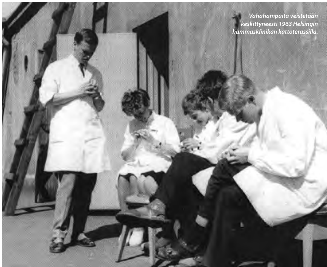
Vahahampaista veistetään keskittyneesti 1963 Helsingin hammasklinikan kattoterassilla.