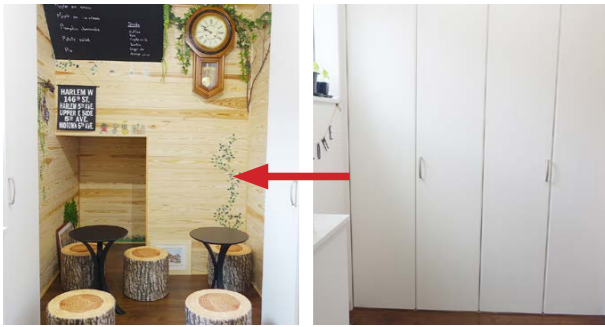
クローゼットとおもいきや(右)、扉を開けると生徒の保護者のための待合室に(左)