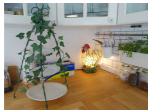
手作りのアフタヌーンティースタンドとにわとりランプ カナダの実家から持ってきたものです

ミルクシェイカー 以前レストランでミルクシェイクを作っていました。この形は日本にはなく、大変柔らかく作れます。デザインも60年代っぽいのでバックトゥーザフューチャーみたいで大好きです