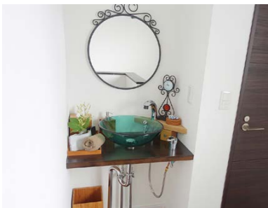
洗面所も全部県外まで足を伸ばして買い揃えました