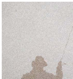
馬込川でよく釣りをしています。 夜釣りもよく行きます