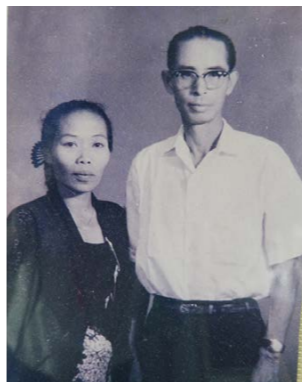
日本人の祖父とインドネシア人の祖母