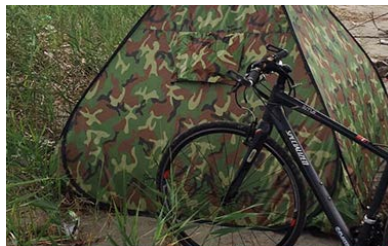
最近は自転車ではなくバイクで行きます