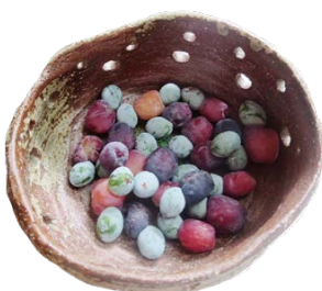
日本の障がい者の授産所で購入した器

下駄箱の上に子供の工作の作品や、授産所で購入した器や鍵入れを飾っています。意味のあるものをそばに置きたいと思っています。