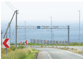
門型標識柱の撤去前