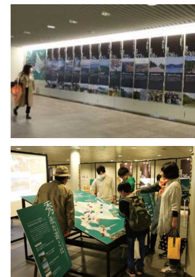
札幌圏でのイベント