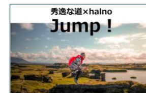
多様な主体との連携