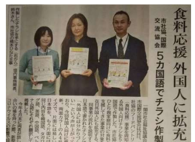
▲ 岩手日日掲載（11月14日付）

多言語チラシの作成に伴い、翻訳作業にご協力くださいましたボランティアの皆様、大変ありがとうございました。