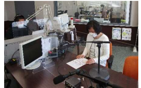
▲中国語での収録風景

協会 Facebook の他、ホームページ、一関市ホームページ内にある English Guide で、毎月一回更新しています。協会窓口では、配布も行っていますので お知り合いの方で必要な方がいらっしゃれば、ぜひご活用ください。