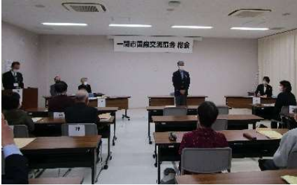
▲荒木会長より会長再任の挨拶