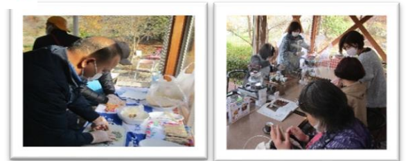
▲ 昨年度の「いちのせき市民フェスタ」での様子

*新型コロナウイルスの感染拡大状況によっては、急遽中止や規模縮小になる可能性があります