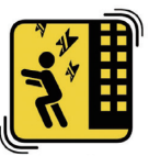
ระมัดระวังของที่อาจตกใส่