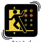
ใช้บันไดที่ใกล้ที่สุด