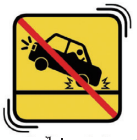
ไม่เบรกกะทันหัน