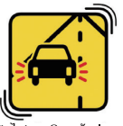
เปิดไฟฉุกเฉินแล้วค่อยๆลดความเร็วลง

ผ่านทางโทรทัศน์ วิทยุ โทรศัพท์มือถือ ฯลฯ โดยเร็วที่สุด เมื่อได้เห็นหรือฟังประกาศเตือนภัยแผ่นดินไหว พยายามควบคุมสติและอยู่ในที่ปลอดภัย หากเกิดปัญหาหรือความยากลำบากใดๆขึ้น กรุณาสอบถามที่ป้อมตำรวจ