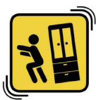
ออกห่างจากเฟอร์นิเจอร์