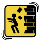
ออกห่างจากรั้ว