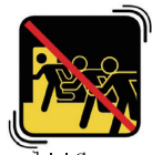
ไม่แข่งรีบออกไปข้างนอก