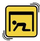
ระวังศีรษะ

ที่ประเทศญี่ปุ่นมีแผ่นดินไหวเกิดขึ้นอยู่บ่อยครั้ง จึงมีการ“ประกาศเตือนภัยแผ่นดินไหว”ล่วงหน้าจากสำนักงานอุตุนิยมวิทยาเพื่อให้ทราบถึงความรุนแรงของการสั่นสะเทือนที่เกิดจากแผ่นดินไหว ซึ่งเป็นระบบที่มีลักษณะเฉพาะของญี่ปุ่น โดยหลังจากเกิดแผ่นดินไหว จะมีการคาดการณ์ระดับความรุนแรงของการสั่นสะเทือนในแต่ละพื้นที่ และประกาศให้ประชาชนทราบ