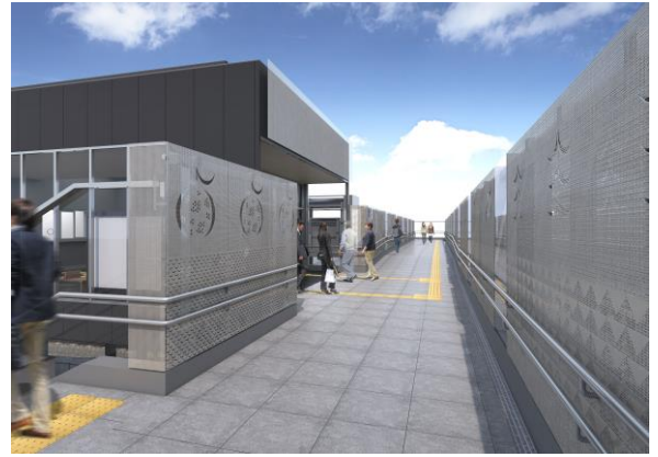
【 自由通路 】