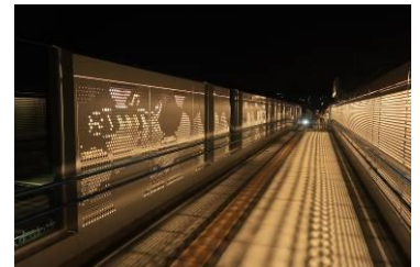
【 自由通路夜間照明 】