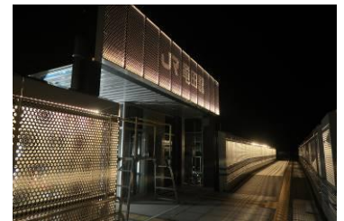
【 駅舎夜間照明 】