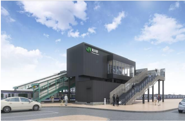
【 橋上駅舎 】