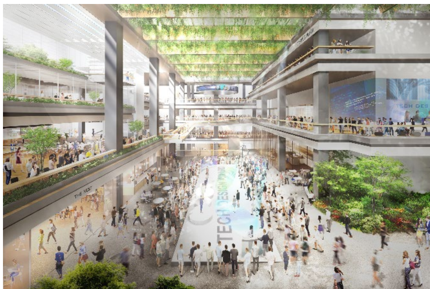
複合施設 A 低層部内観

※完成予想イメージは計画段階のものであり、今後の協議などにより変更となる可能性があります。