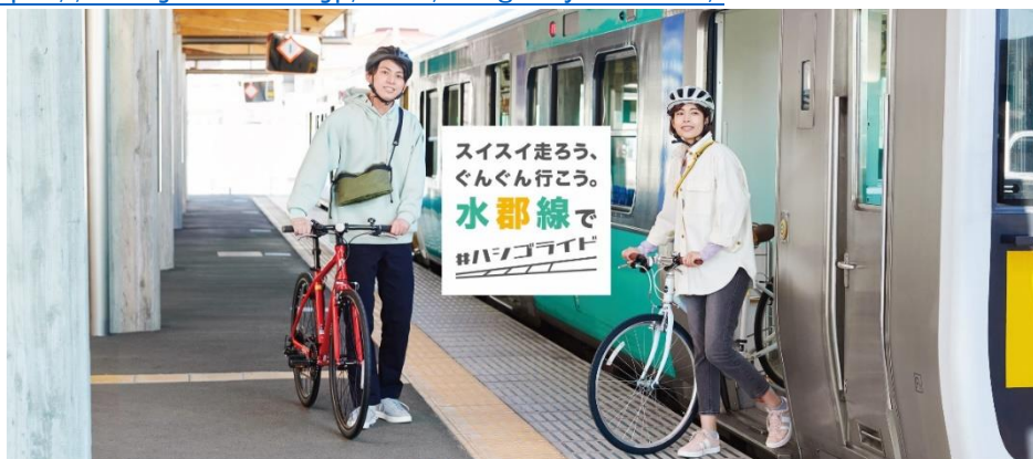
「水郡線サイクルトレイン」WEBサイト（イメージ）

https://www.jreast.co.jp/mito/suiguncycletrain/