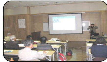
一緒に考えましょう