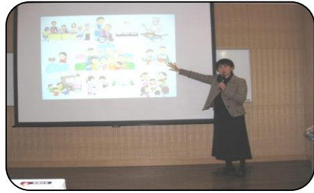
こんなときどうしますか？

まず講義形式で金沢区内に住んでいる外国人につながる人々の背景を学びました。次に参加型のワークショップ形式で、外国人と会ったときのシミュレーション劇を実演したり、韓国語と日本語による読み聞かせを聴きそれぞれの言葉の響きを味わったりしました。参加者同士気づいたことを話し合い、コミュニケーションについて考える良い機会となりました。