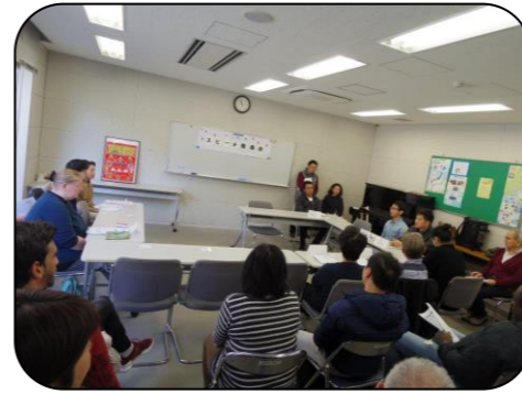
ボランティアが おうえんします