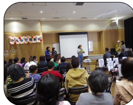
たくさんの人の前で