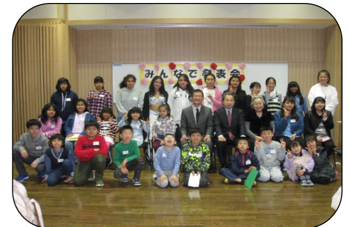
みんなで いっしょに