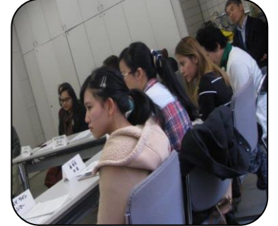
こんどは わたしかな