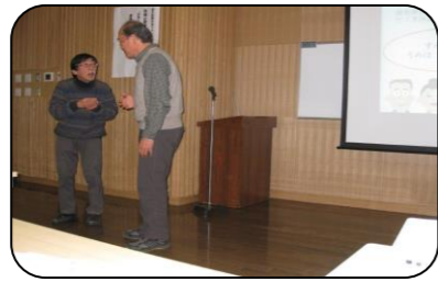
外国人に会ったら・・・