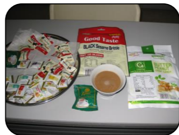
お菓子お茶を楽しむ