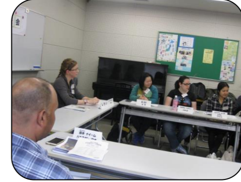
じゅんばんに話します