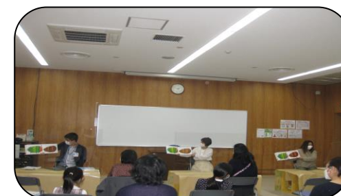
絵本を日本語・韓国語・スペイン語で