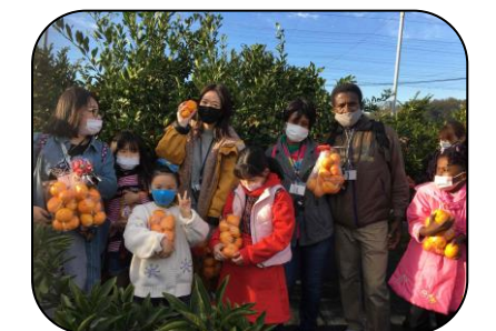
たくさんとったよ