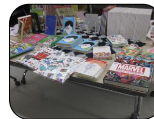
おなじ絵本が多言語で