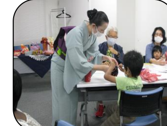
ていねいに教える先生