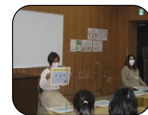
救急車 韓国語では？