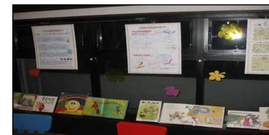
世界の絵本と内容を紹介