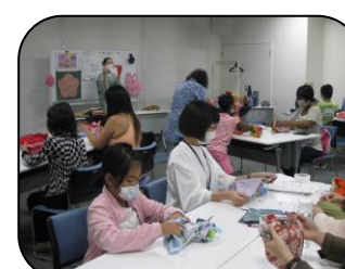
こうやって結ぶの