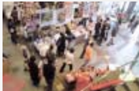
ブース出展の様子

お陰さまで当日は2,000名を超える多くの方々にご来場いただき、出展者、来場者双方にとって好評でしたので、今後も是非、この「旅行博」を熊本で開催して参りたいと思います。ご期待ください。