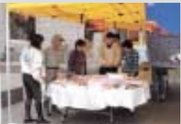
パンフレット展示の様子