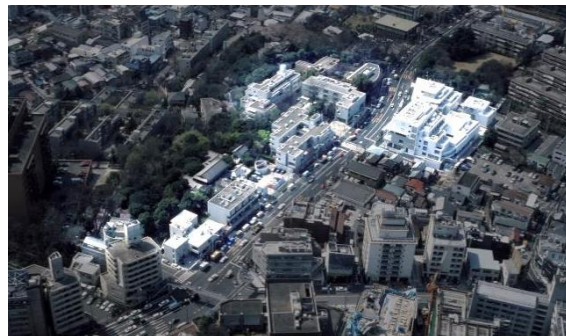
代官山ヒルサイドテラス(日本、東京) ※2