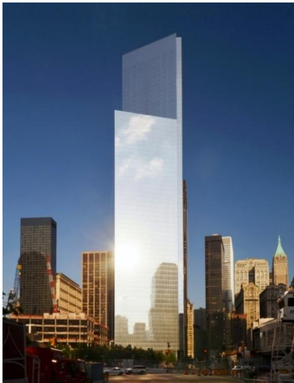
4 ワールド・トレード・センター(米国、ニューヨーク) ※1