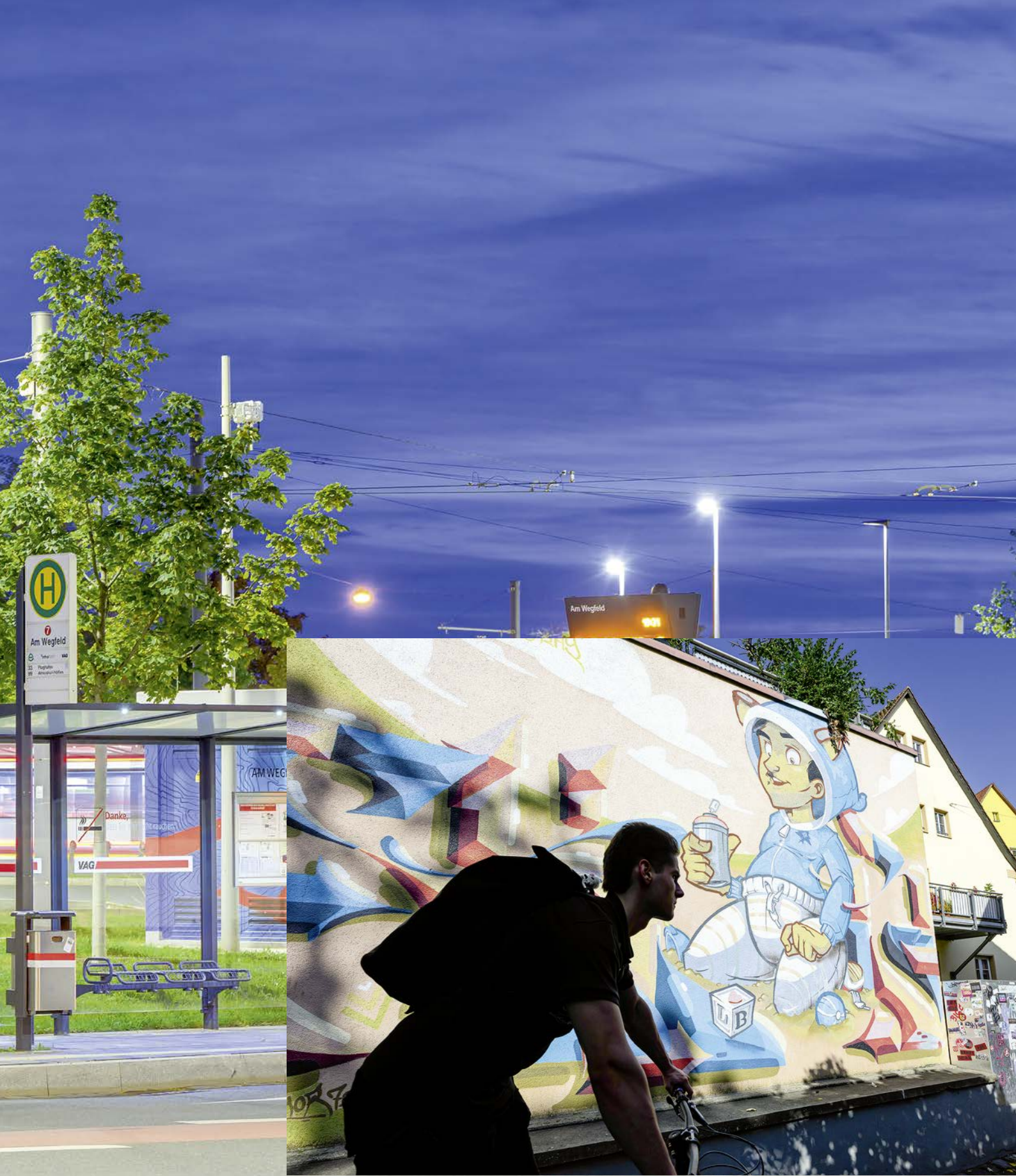
Eine verspielte Fassade versteckt sich am Hübnersplatz 12. „Letting the kids play“ von Hombre SUK und Skor 72 ziert hier eine Mauer.