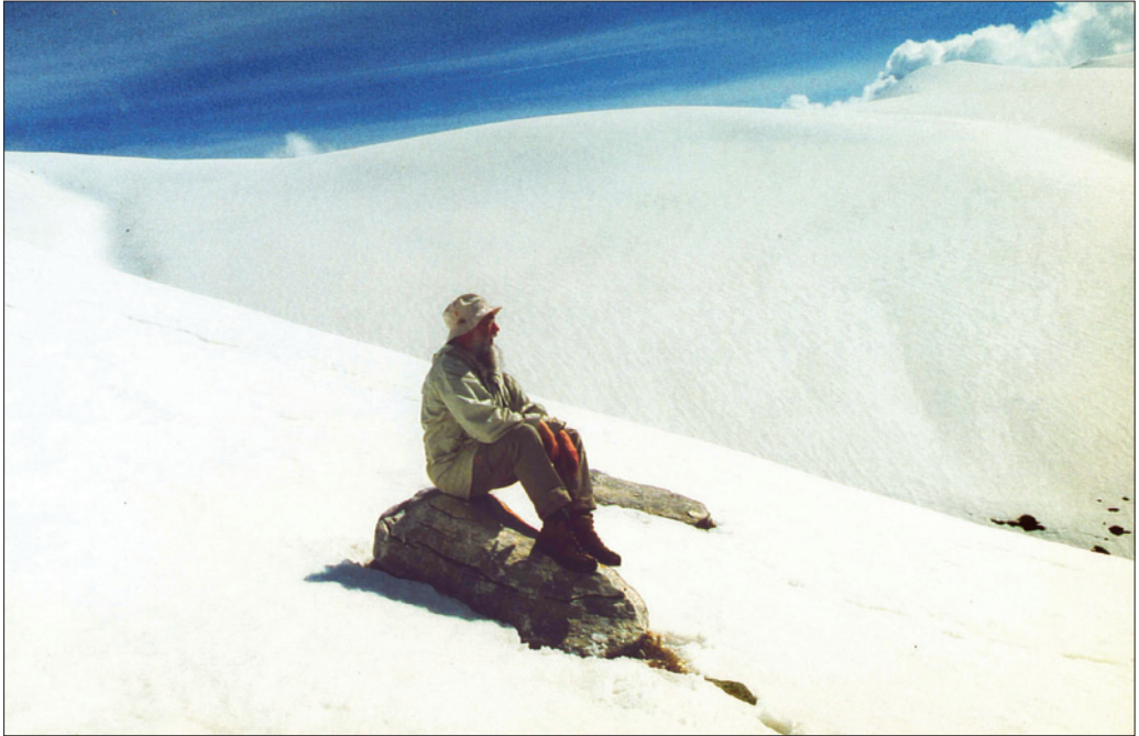
2001 auf dem Olymp (Selbstporträt).

die Kanaren. Es kamen insgesamt 51 Kartierungsreisen zustande, von denen er 42 alleine durchführte, davon 37 nach Griechenland, und 9 zusammen mit Künkele. Weitere Daten sammelte er im Rahmen von Familienurlaube in denselben Regionen. Um seine Kartierungen zu komplettieren und letzte Kenntnislücken zu Vögeln, Reptilien und Orchideen der griechischen Inseln zu schließen, unternahm er unter großen gesundheitlichen Mühen zwei Monate vor seinem Tod eine Reise auf Kos und die Nachbarinseln, die er aber dann vorzeitig abbrechen musste. Mit sehr wenigen Ausnahmen (einige unbesiedelte Eilande) hat er schließlich alle griechischen Inseln im Rahmen seiner Erfassungen mindestens einmal besucht, ferner auch fast das gesamte Festland, wobei er sich hier später auf die Hochlagen konzentrierte und weitere detaillierte Erfassungen seinem Freund Hartmut Heckenroth und Mitarbeitern überlassen hat. Durch diese umfassenden Kartierungen schuf er eine einzigartige Datensammlung, penibel gebunden, die er aber leider nicht mehr selbst in den lange mit Heckenroth geplanten