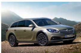
Opel Insignia Country Tourer