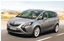
Opel Zafira Tourer

Der Opel Cascada ist ein 4,70 Meter langes, elegantes Mittelklassecabrio. Der klassische Viersitzer hat eine gestreckte Silhouette und ein aufwendig verarbeitetes Textilverdeck, das Open-Air-Fahrspaß in Premiumqualität zu einem attraktiven Preis ermöglicht. Das Verdeck lässt sich per Knopfdruck auch während der Fahrt bei Geschwindigkeiten von bis zu 50 km/h in 17 Sekunden Öffnen und Schließen. Im Stand ist dies sogar über die Fernbedienung möglich. An der Vorderachse des Cascada kommt mit der HiPerStrut-Aufhängung (High Performance Strut = Hochleistungsfederbein) die beste Opel-Chassis-Technologie zum Einsatz, die aus den OPC-Modellen bekannt ist.