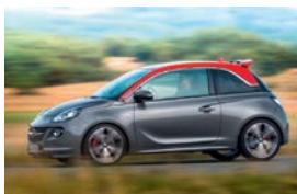
Opel ADAM S

Als dreitüriger urbaner Mini-Crossover mit 3,75 Metern Länge begründet der ADAM ROCKS sein eigenes, neues Marktsegment. Er ist ein stylischer Trendsetter und grenzenloser Individualisierungs-Champion – auf Wunsch auch mit hochwertigem Swing Top Stoff-Faltdach. Der 1.0 ECOTEC Direct Injection Turbobenziner der neuesten Generation mit Sechsgang-Getriebe sowie das moderne IntelliLink-Infotainment-System mit Integration von AndroidAuto und Apple CarPlay unterstreichen seinen Sonderstatus unter den Kleinwagen. Die anthrazitfarbene Schutzverkleidung betont den robusten, muskulösen Charakter des ADAM ROCKS. Spezielle Dekorelemente machen den ADAM ROCKS einzigartig. Das auf Wunsch lieferbare falt-Verdeck fährt per Knopfdruck in nur fünf Sekunden zurück. Die Crossover-Variante ist auch als ADAM ROCKS S mit 1.4 Turbo-Benziner und 150 PS zu haben.