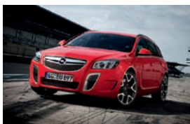
Opel Insignia OPC