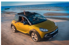
Opel ADAM ROCKS