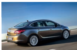
Opel Astra four-door/Viertürer