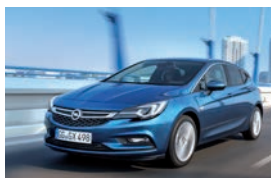
Opel Astra five-door/Fünftürer