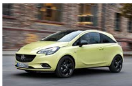
Opel Corsa Three-door/Dreitürer