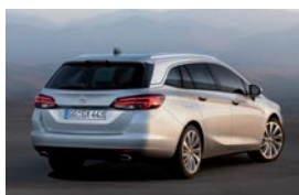
Opel Astra Sports Tourer