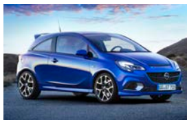
Opel Corsa OPC