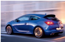
Opel GTC OPC