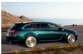
Opel Insignia Sports Tourer