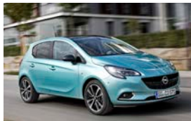
Opel Corsa Five-door/Fünftürer