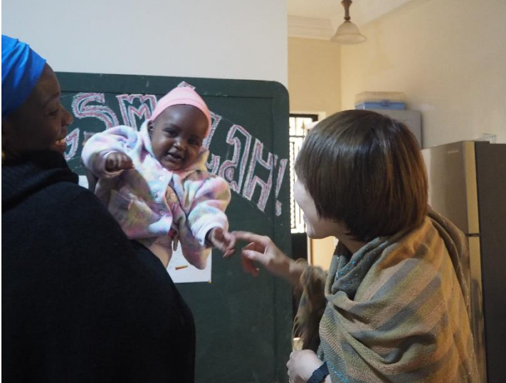
ごがく学校みんなのアイドル“オルトンス”ちゃん

セネガルで自己紹介をするとき、日本の名前ではなく、セネガルネームで自己紹介をします。