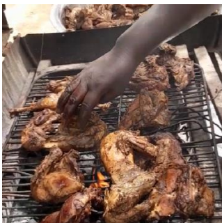
先生たちが作る手作りの おいしいお昼ごはん