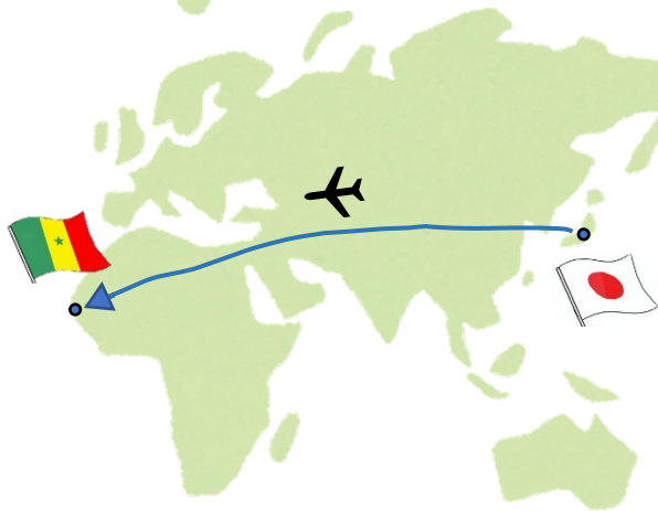
世界地図でみる日本とセネガルの場所