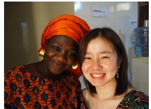
ごがく学校の先生

言葉はコミュニケーションをとる中でとても大切だと考えています。私ももっとフランス語と現地語を話せるようになって、セネガル人の方々と仲良くなりたい！！