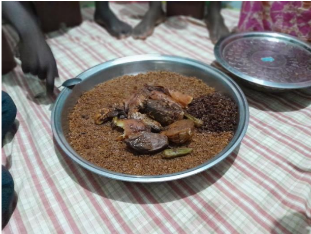
大皿をみんなでかこんで食べます