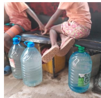
大きなペットボトルに 海水を入れて持って帰ります