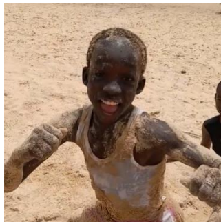
ごうかいに砂遊び