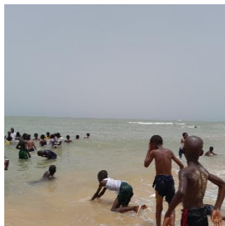
少しずつ海にもなれてきて みんなで泳ぐ練習