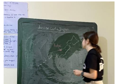
ウォロフ語で福井県の紹介