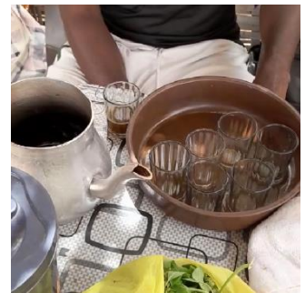
海でもアタヤ (セネガルでよく飲まれるお茶)