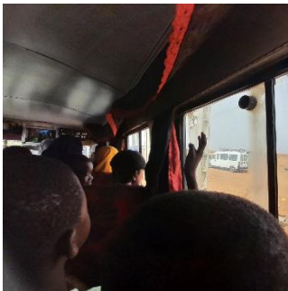
大音量のセネガルミュージックを ききながら移動