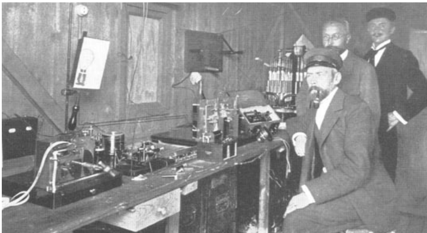
Bild «Z1» E68 Funktelegraphenstation im Lotsenhaus, Cuxhaven, 1901. Mitte stehend Prof. F. Braun.