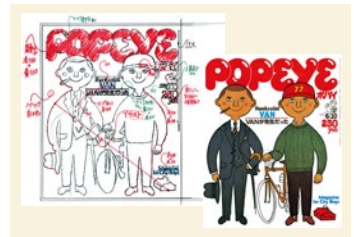
新谷雅弘《POPEYE》封面排版原稿)2023年(重新制作)和《POPEYE》1978年6月10日期封面

设计师新谷雅弘(居住于岛根县隐岐郡,1943-),参与了由堀内诚一(1932-1987)进行艺术指导的革新性杂志《anan》的创刊(1970),之后在《POPEYE》、《BRUTUS》、《Olive》(均为MAGAZINE HOUSE刊物)中担任艺术指导。本展展示了编辑设计的魅力。