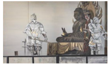
落合朗风《华严佛》,1931年,鹤布山珍藏寺藏

落合朗风(1896~1937)是活跃于大正至昭和初期的日本画家。1934年创设明朗美术联盟,之后不断发布打破“日本画”固有概念的先驱式作品。让我们在其有着深厚渊源的岛根,思考落合朗风与其同伴们当时是如何描绘未来蓝图而开展活动的。