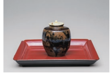
중요문화재 <<중국 각진 어깨 차 용기 별명: 아부라야>> 중국 남송~원 시대(13~14세기) 하타케야마 기념관 소장

주식회사 에바라제작소의 창업자이자 풍류를 즐겼던 하타케야마 잇세이(호: 소쿠오)는 오랫동안 미술품을 수집하여 하타케야마 기념관을 설립했습니다. 이 전시는 시설 개축 공사를 위해 휴관 중인 하타케야마 기념관의 컬렉션 가운데서 차노유, 린파의 명품과 더불어 마쓰다이라 후마이와 관련 있는 물건을 소개합니다. 주고쿠·시코쿠 지역에서 처음으로 개최되는 하타케야마 기념관의 전시회입니다.