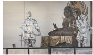
오치아이 로후 <<화염불>> 1931년 가쿠후잔 진조지 절 소장

오치아이 로후(1896~1937)는 다이쇼 시대부터 쇼와 시대 초기에 걸쳐 활약한 일본 화가입니다. 1934년에는 메이로 미술연맹을 창설하여 ‘일본화’의 기성 개념에 파문을 일으키는 선구적 작품을 연이어 발표했습니다. 로후와 그의 동료들이 어떤 미래를 꿈꾸며 활동했는지, 그와 인연이 깊은 시마네에서 생각해 보겠습니다.