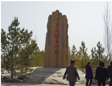
寧夏島根友好林記念碑