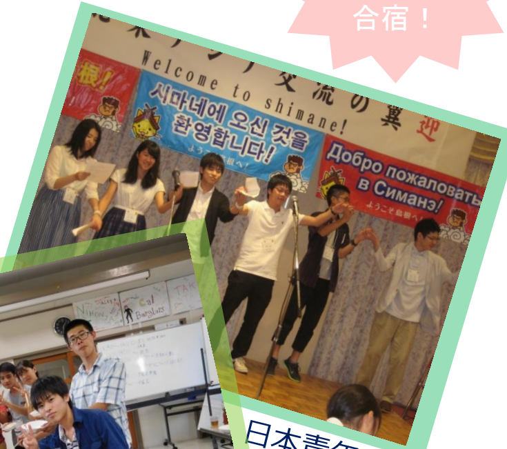
日本青年の出し物☆