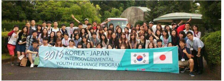
昨年度の事業の様子