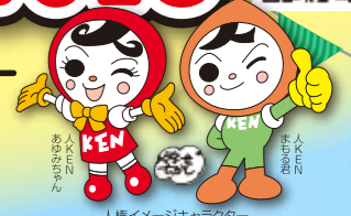
人権イメージキャラクター