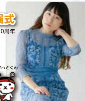
江津市PRキャラクター 人麻呂くんとよさみ姫 えいとくん