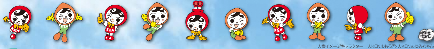
人権イメージキャラクター 人KENまるもる君・人KENあゆみちゃん